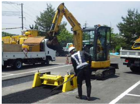
② 合材投入 バックホーで合材を投入