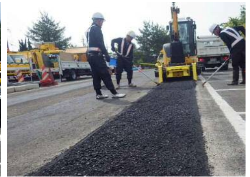
③ 敷均し レベラーを引き寄せながら 敷き均す