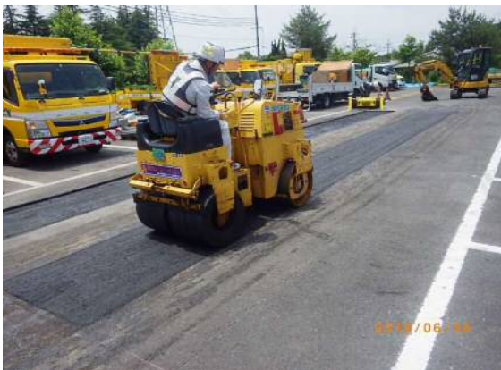
④ 転圧 ・ 仕上げ