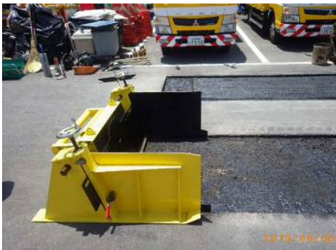
① レベラー設置 施工幅、舗装厚などを確認し、 切削面ガイドバーを設置